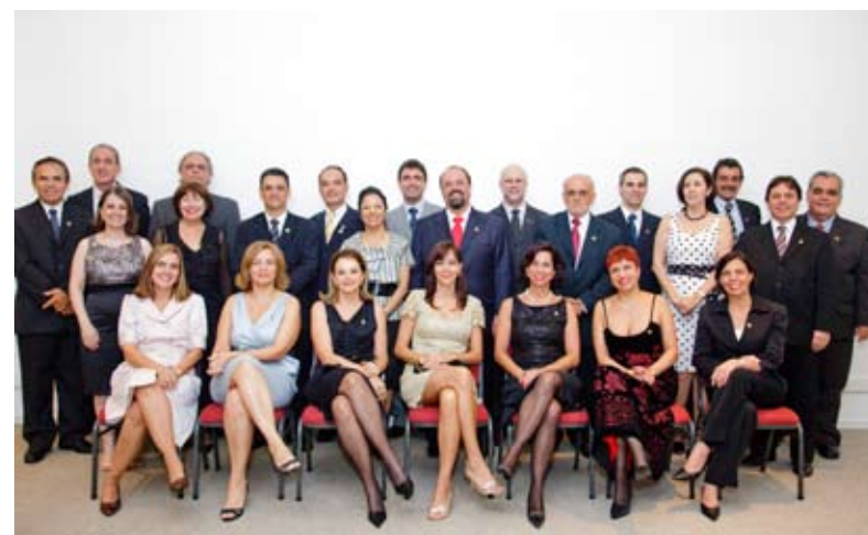
Novo conselho é composto por 31 profissionais

“Ao realizar esse planejamento a ABRH-MG irá ao encontro de seu público e também vai abrir espaço para o associado estar dentro da entidade ampliando a troca de experi-