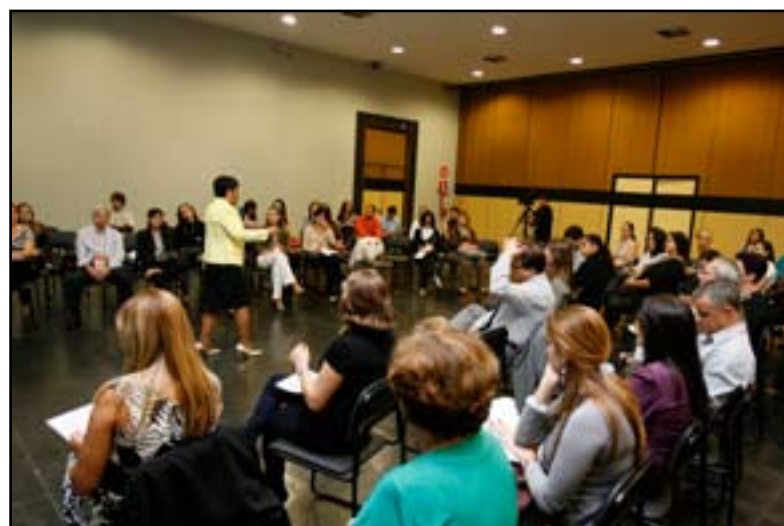
Oficina “Liderança e Qualidade de Vida” fez parte das atividades

A diretoria da ABRH-MG informa que as inscrições para a 10ª edição do Prêmio Ser Humano foram adiadas. Os interessados podem se inscrever a partir do dia 4 de outubro até o dia 30 de março de 2011. A cerimônia de premiação também irá ocorrer em maio do ano que vem, durante a programação do XV Congresso Mineiro de Recursos Humanos. A data de sua realização e outras informações serão divulgadas oportunamente. Em caso de dúvidas e esclarecimentos favor entrar em contato com a ABRH-MG pelo telefone (31) 3227 5797 ou e-mail abrhmg@abrhmg.org.br .