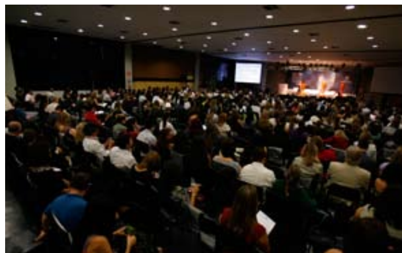
COMRH 2010 reuniu grande público em todas as palestras